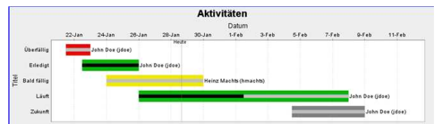
Abb.2 – Gantt-Diagramm

Auch der Export von Aktivitätslisten nach MS Project und die Anzeige von Aktivitäten als Gantt-Diagramm (Abb.2) sind entscheidende Neuerungen.